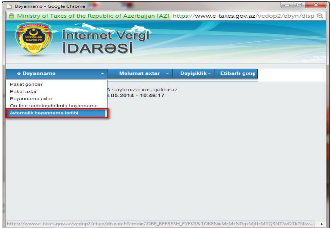
Şəkil 1. Avtomatlaşdırılmış bəyannamə tərtibi alt-menyusu

Avtomatlaşdırılmış Bəyannamə Tərtibi (ABT) üçün istifadəçi "İnternet Vergi İdarəsinin" Avtomatlaşdırılmış Bəyannamə Tərtibi (ABT) menyusuna daxil olur: