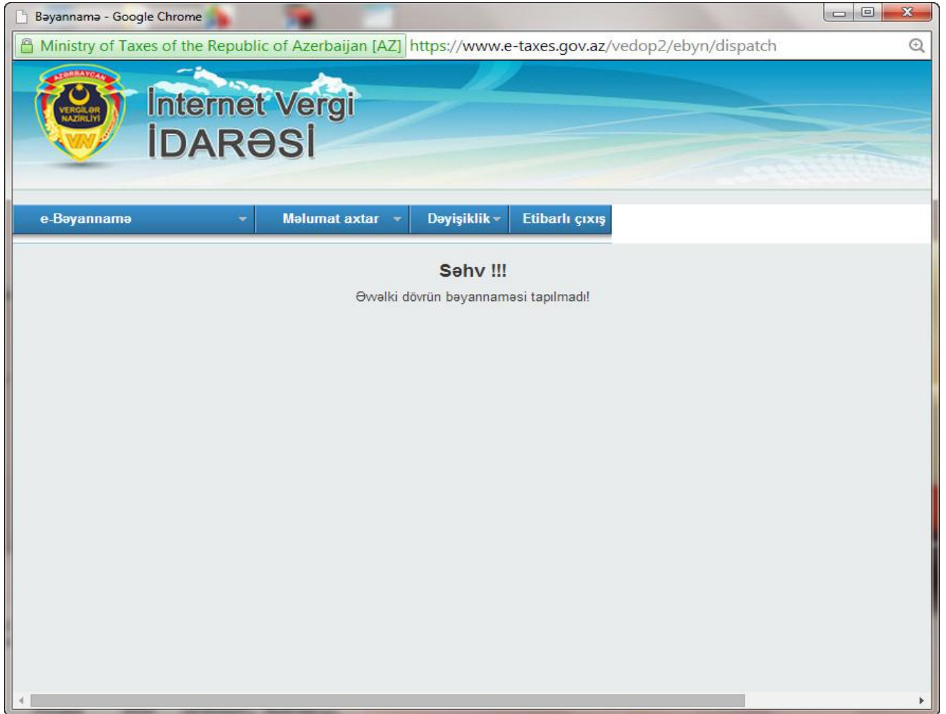
Şəkil 3. Əvvəlki dövrün bəyannaməsi tapılmadı

Vergi ödəyicisinin əvvəlki dövr üzrə bazada bəyannaməsi mövcud olmadıqda ekranda Şəkil 3-də qeyd olunan xəbərdarlıq ismarıcı əks olunur: